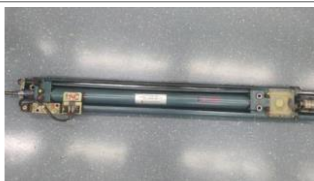
도어엔진 및 일체형 전자변 교환